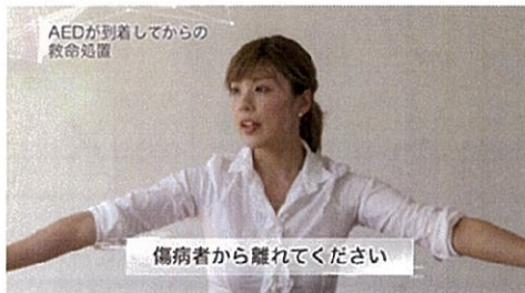
③AEDが心電図を解析 (傷病者へ触れない事)