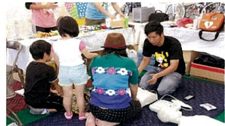
AED体験ブースの様子②