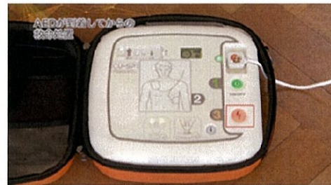
④点滅しているショックボタンを押す