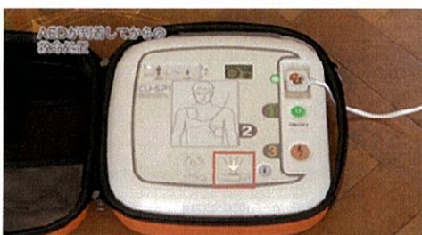
⑤音声ガイダンスに従い、胸骨圧迫を開始する。