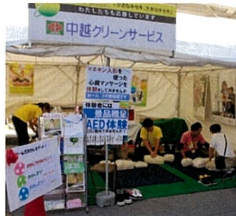
AED体験ブースの様子①