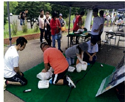
AED体験ブースの様子